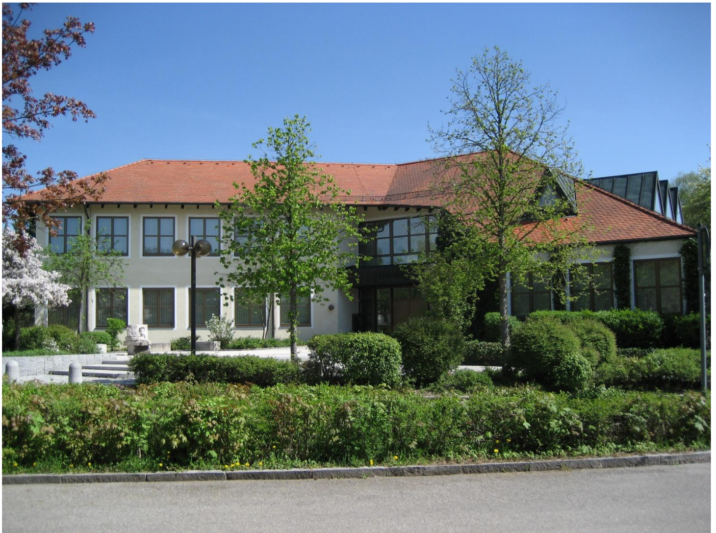
Rathaus Lenting mit Gemeindebücherei, errichtet 1984