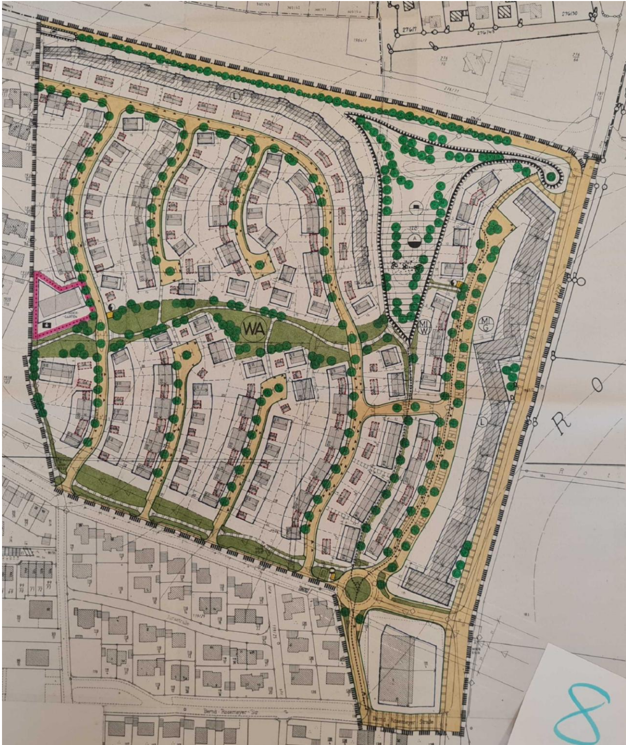
Abb. 1. Ursprungsfassung Bebauungsplan Nr. 13 „Nord II“